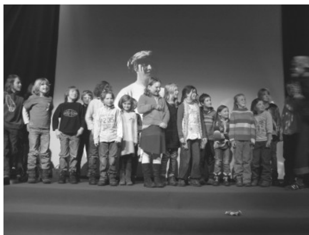
Abb.: Alle Tiger auf der Bühne. geschickt. Die Tiger sind eingeladen worden, weil sie ins Finale gekommen sind. Dort sind alle Filme gezeigt worden. Wir durften sogar selber filmen!

D ie Tiger haben letztes Schuljahr einen Film gedreht. Sie haben den Film zu einem Filmwettbewerb