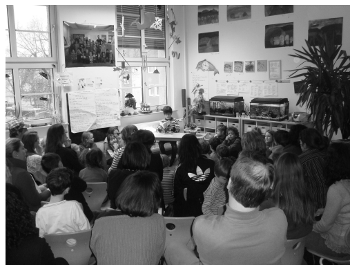
Abb.: Viele Zuhörer bei der Lesung.

D ie Delfine hatten eine Lesung zu ihrem Delfingeschichtenbuch.