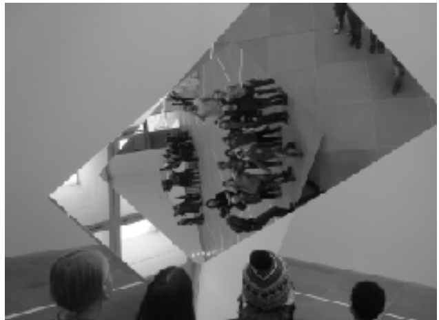
Abb.: Drehender Spiegel

Die erste Gruppe (die in der Wechseiausstellung) sah einen sehr großen Apfel aus Pappmasche und vielen Zeitungsschnipseln. Die andere Gruppe ist in die Ausstellung von Jeppe Hein. Dort gab es Würfel, mit denen wir bauen durften. Es sind Höhlen, Sitze, Burgen und noch vieles mehr entstanden. In diesem Raum gab es auch Spiegel, die sich dauernd gedreht haben und es gab auch Lichterketten. Wenn man nah an die Lichterketten hin ist, sind sie ausgegangen. Wenn man wieder weggegangen ist, sind sie wieder angegangen. Einen großen Spiegel