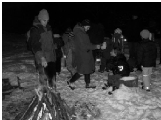
Abb.: Am Lagerfeuer

Die Delfine waren am Silbersee. Es gab Kinderpunsch, Glühwein und Massen an Keksen und Süßigkeiten. Im Silbersee steigen manchmal sehr sehr giftige Gase hoch, trotzdem schwimmen manchmal Jugendliche darin herum.