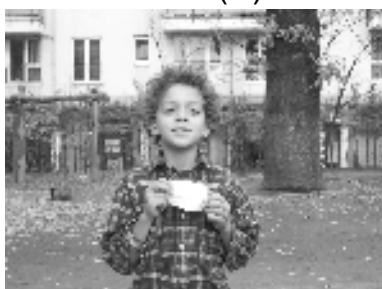
Abb.: Der stolze Gewinner von Anouk (D)