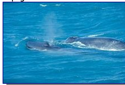
Blauwal mit Kalb