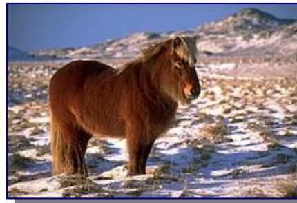
Islandpferd im Winter